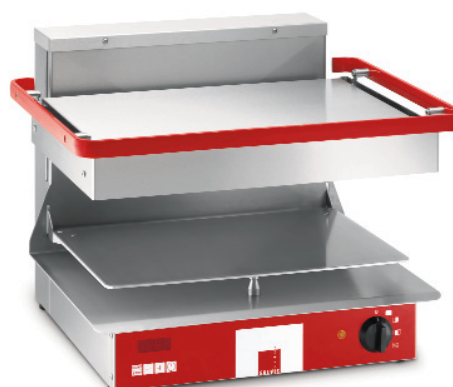
Modèle Classic Pro