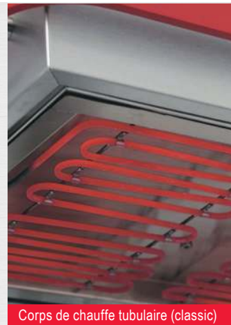
Corps de chauffe tubulaire (classic)