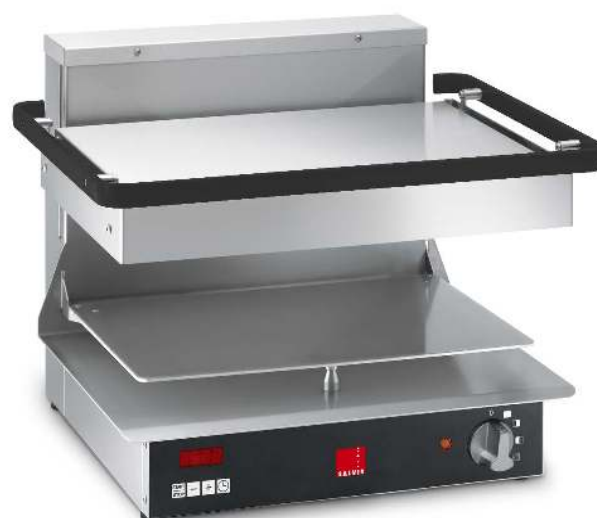
Salamandre Salvis Classic Pro édition noir