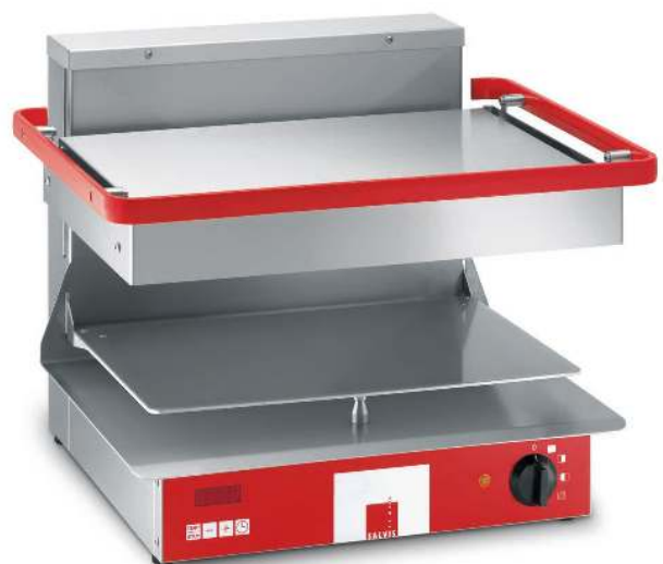
Salamandre Salvis Classic Pro