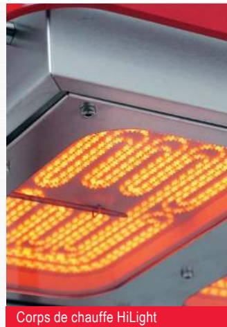
Corps de chauffe HiLight