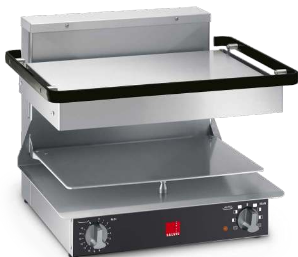
Salamandre Salvis Classic édition noir