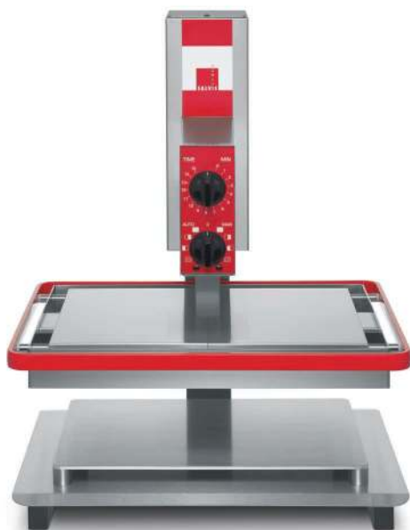
Salamander Salvis Vitesse

La construction raffinée donne un résultat esthétique. Le modèle Salvis Vitesse n'a aucun mal à être intégré de façon optimale dans une cuisine design, de démonstration ou dans une ligne de cuisson.