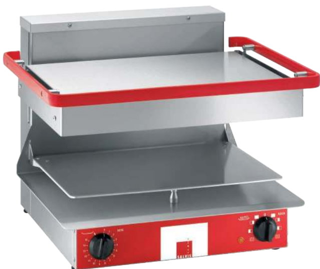
Salamandre Salvis Classic

Grâce à l'usinage de très haute qualité, aux larges rayons et au support d'assiette pouvant être relevé, le nettoyage s'avère aussi simple que rapide..